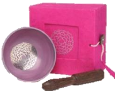
Violett - Kronen Chakra (auch Scheitelchakra)