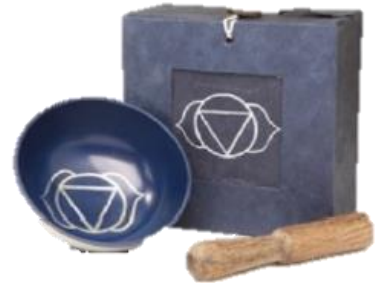
Indigo – Stirn Chakra (auch Drittes Auge)