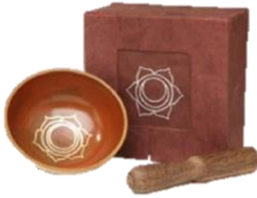
Orange – Sakral Chakra