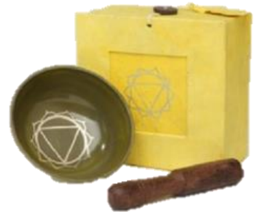
Gelb – Solarplexus Chakra (auch Sonnengeflecht)