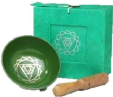
Grün - Herz Chakra (auch Wurzelchakra)