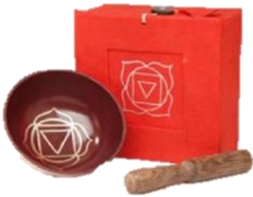
Rot - Basis Chakra (auch Wurzelchakra)

Klänge und Töne spielen in einer Vielzahl von Ritualen eine bedeutende Rolle. Der Klang und die Vibration von Klangschalen wird seit Jahrhunderten von Schamanen genutzt, um zu Reinigen, zu Harmonisieren und Blockaden zu lösen. Diese tibetanischen Klangschalen wurden von Hand nach traditionellen Überlieferungen gefertigt, um mit jedem der 7 Energiezentren des Körpers, den Chakren in Resonanz zu gehen.