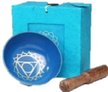
Blau – Kehl Chakra